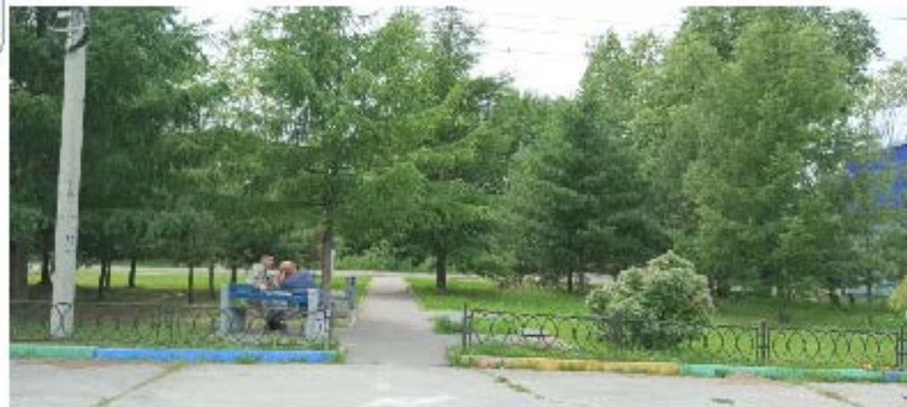
ФОТО И ВИЗУАЛИЗАЦИЯ