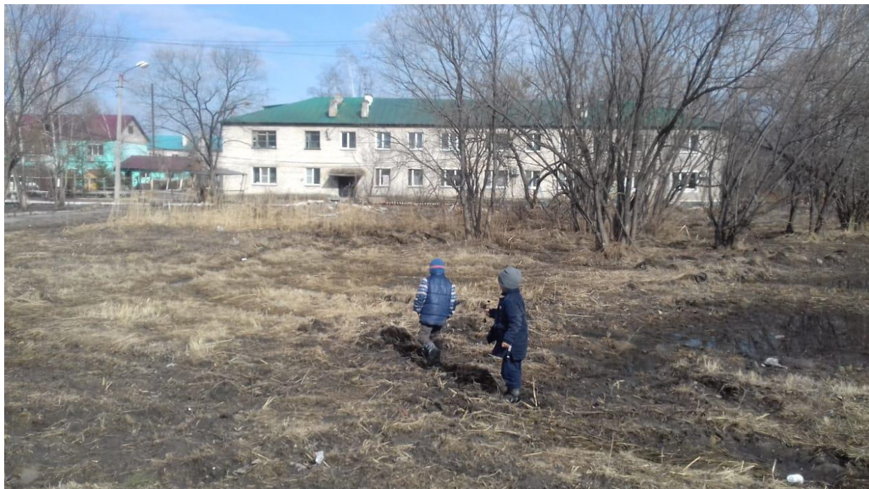
Фото территории в настоящее время