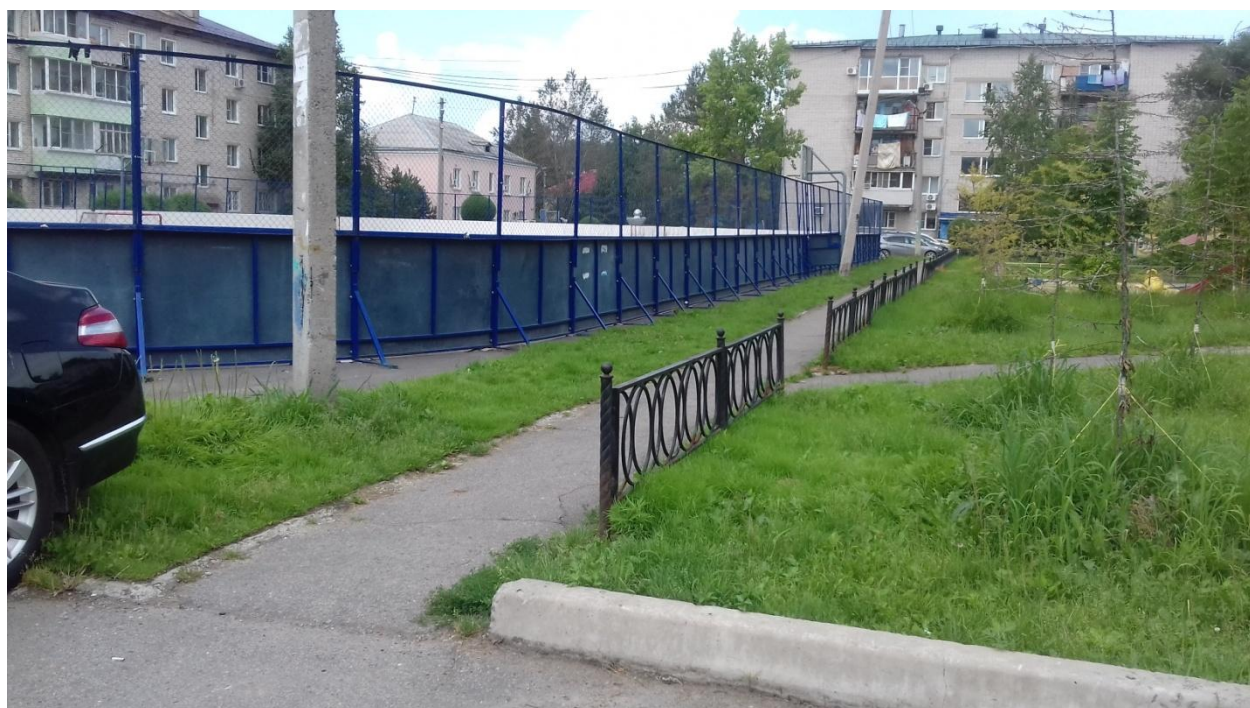
Фото территории в настоящее время