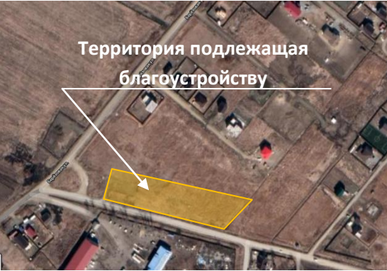
Территория подлежащая благоустройству